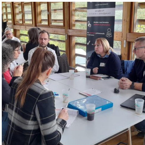
Séminaire des acteurs locaux de l'emploi, de l'insertion, novembre 2022

L'agence nationale de la cohésion du territoire (ANCT) met en place une étude nationale sur 8 territoires sur la problématique de l'attractivité des métiers et des formations. Notre territoire a été retenu pour intégrer ce dispositif d'étude qui produira un rapport local et un rapport national.